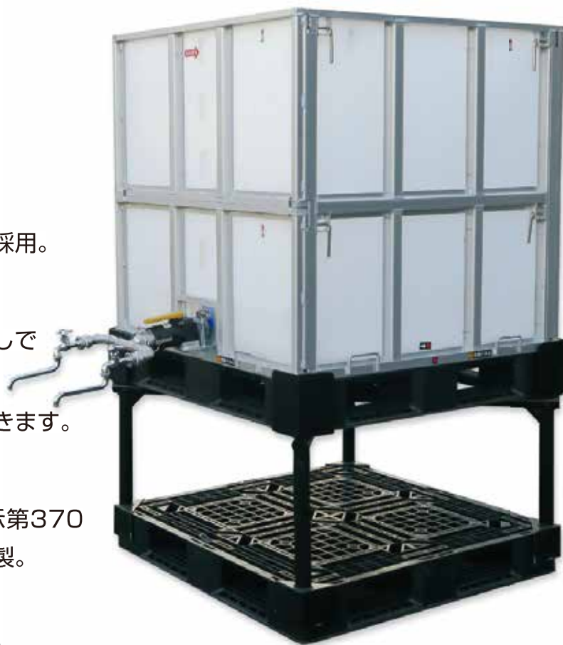
型式 KEC-A-100 (アルミ)